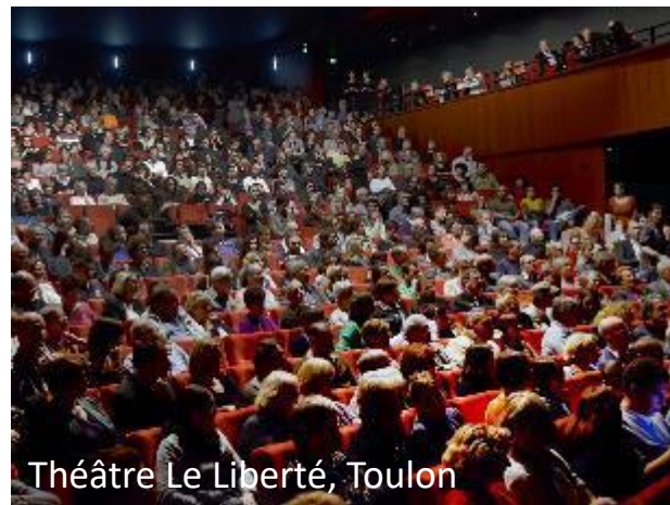
Théâtre Le Liberté, Toulon