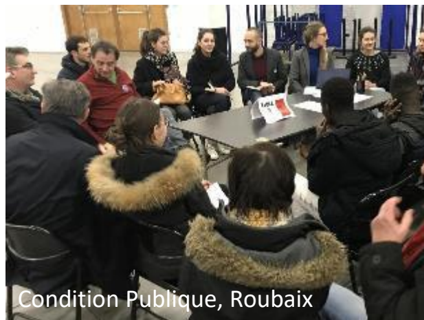
Condition Publique, Roubaix