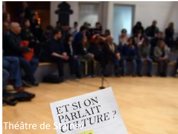
Théâtre de St Omer