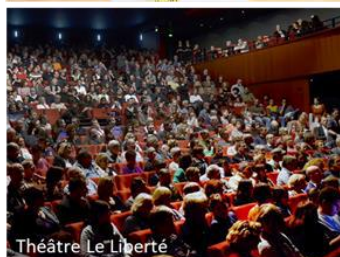
Théâtre Le Liberté