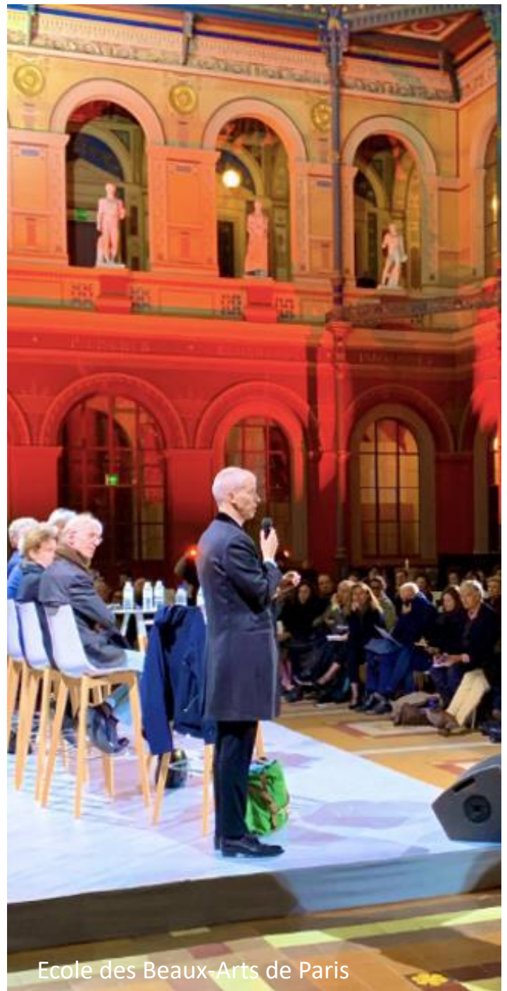
Ecole des Beaux-Arts de Paris