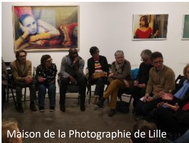
Maison de la Photographie de Lille