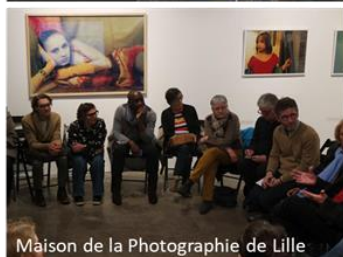
Maison de la Photographie de Lille