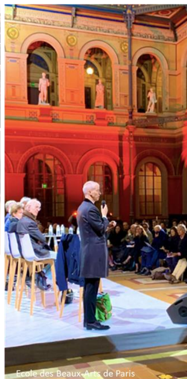
Ecole des Beaux-Arts de Paris