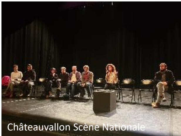
Châteauvallon Scène Nationale