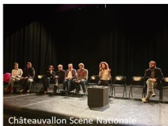
Châteauvallon Scene Nationale